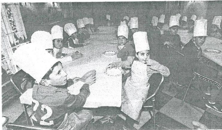
Aprender no sabemos si aprenden a cocinar, pero atentos sí que estuvieron | ÁLVARO BALLESTEROS