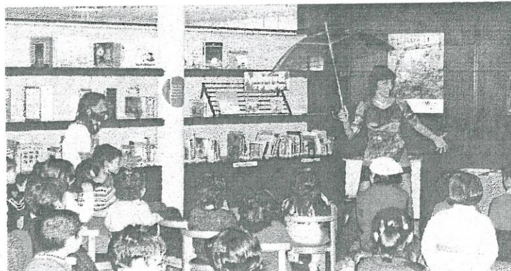
La sesión de animación a la lectura «Hixinio e Cristina cantan outro» reunió a un nutrido grupo de niños